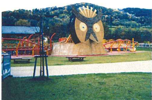
旭川カムイの杜公園