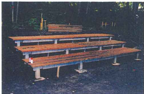
北海道大学・ボードウオーク