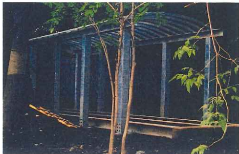
北海道大学・ボードウオーク